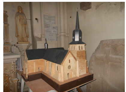
Maquette d'Alfred Bossard