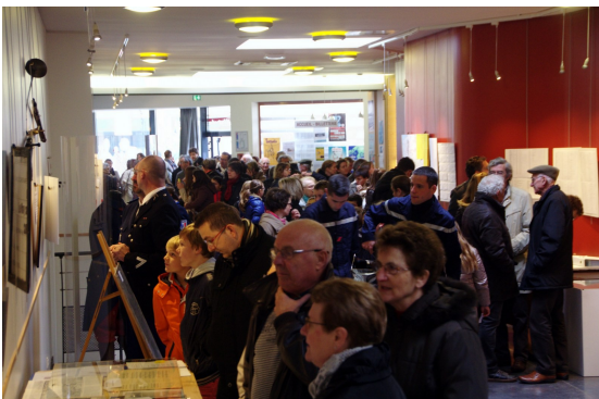
Chacun est intéressé