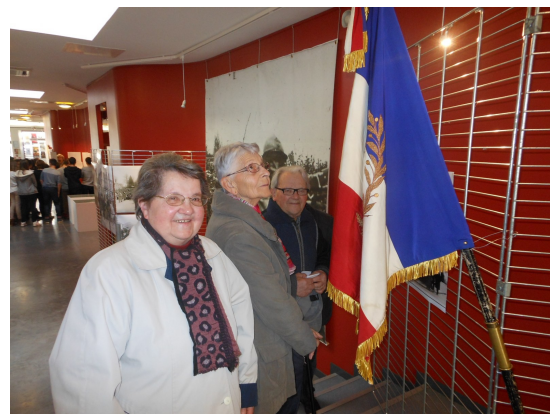
Le Drapeau rénové de 1914-1918