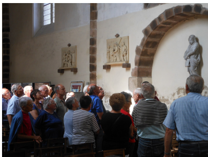
Ecoute attentive du guide

Par ailleurs, via la Fondation du Patrimoine , se prépare une approche des mécènes (pourquoi pas vous –individus ou entreprises- avec des avantages fiscaux à l'appui ?-pensez y).