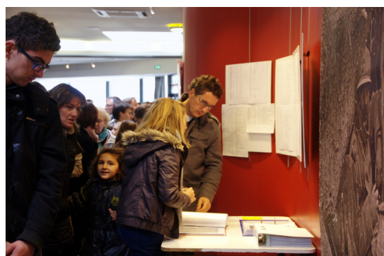
À la recherche des militaires de la famille